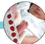
Errores congénitos del metabolismo