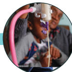
Ictus y enfermedades neurológicas