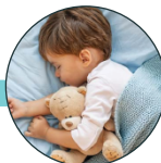
Alergia a la leche de vaca, Enfermedad renal