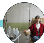
Desnutrición relacionada con la enfermedad (por ejemplo, cáncer)